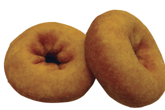
豆乳ドーナツ 1パック(5個入) ¥160(税抜き)

原材料名:小麦粉、調整豆乳(大豆、水飴、食塩)、砂糖、ショートニング、全卵、脱脂大豆、粉末油脂、脱脂粉乳、果糖、卵黄粉、食塩、膨張剤、乳化剤(大豆由来)、トレハロース、香料、乳酸カルシウム、シリコン