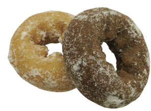
ツインドーナツ 1パック(5個入) ¥160(税抜き)

素朴で懐かしいアメリカンと、子どもたちの大好きなチョコレートを組み合わせました。