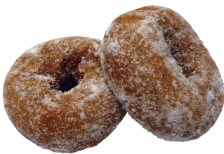
ほうじ茶ドーナツ 1パック(5個入) ¥160(税抜き)

原材料名:小麦粉、砂糖、ショートニング、ぶどう糖、ほうじ茶、全卵、粉末油脂、脱脂粉乳、果糖、卵黄粉、食塩、でん粉、植物油脂、膨張剤、乳化剤(大豆由来)、香料、シリコン