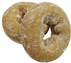
アメリカンドーナツ 1パック(5個入) ¥160(税抜き)

原材料名:小麦粉、ショートニング、砂糖、ぶどう糖、全卵、粉末油脂、脱脂粉乳、果糖、卵黄粉、食塩、でん粉、植物油脂、膨張剤、乳化剤(大豆由来)、香料、シリコン