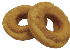
オールドファッションドーナツ 1パック(5個入) ¥160(税抜き)

原材料名:小麦粉、砂糖、ショートニング、粉末油脂、全卵、脱脂粉乳、果糖、卵黄粉、食塩、膨張剤、乳化剤(大豆由来)、増粘剤(グアム)、香料、着色料(ビタミンB2)、シリコン